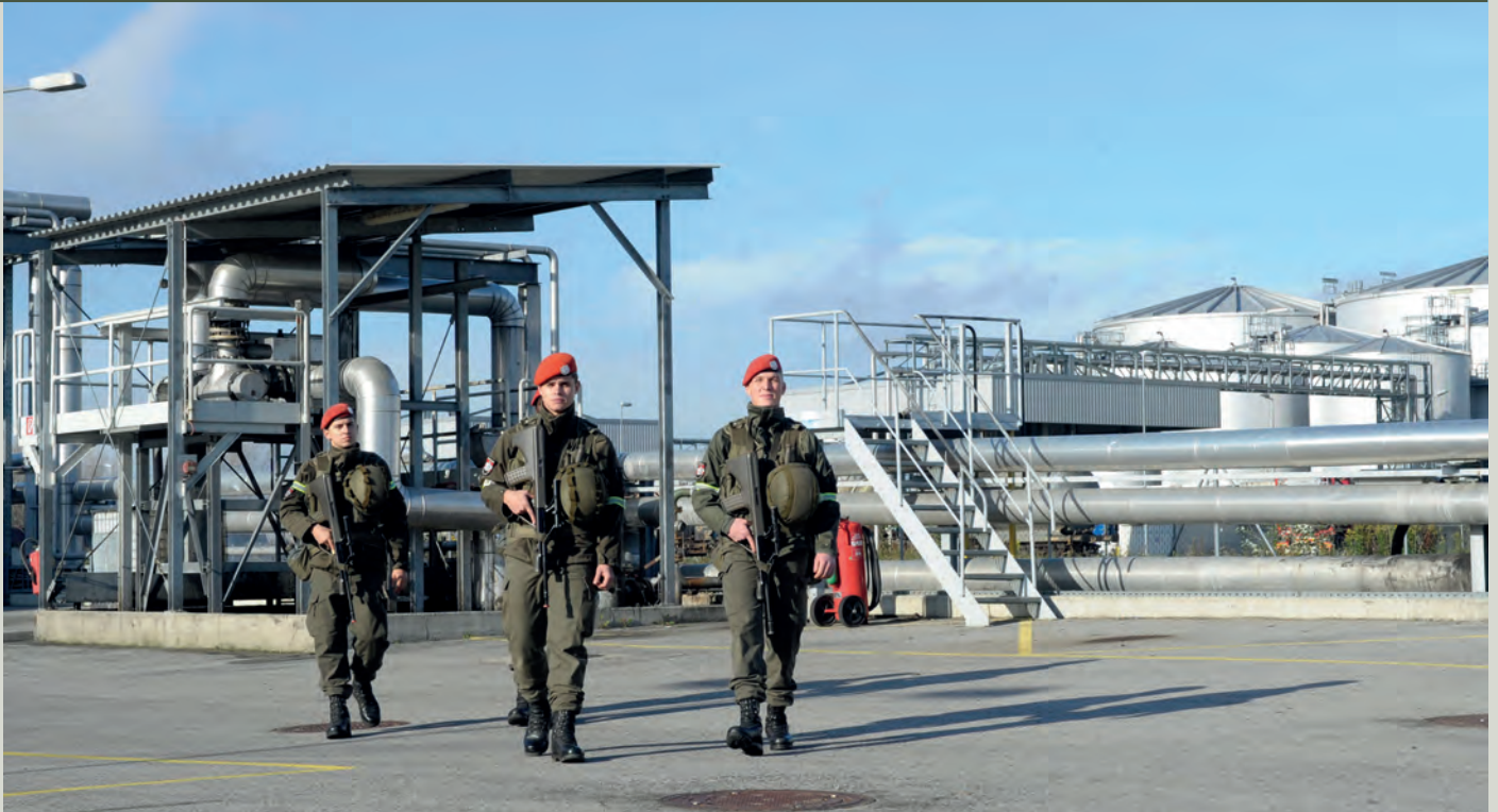
Einsatzszenario Bei einem Blackout hilft das Bundesheer und schützt zum Beispiel kritische Infrastruktur. Wichtig ist zudem, dass sich auch jeder Soldat und jede Soldatin in der Familie und im privaten Umfeld bestmöglich auf ein derartiges Szenario vorbereitet.